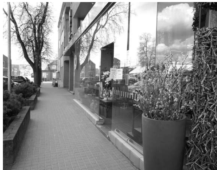
Gėlių salonas „Gėlių lanka“ išsikūręs strateginėje miesto vietoje - A.Baranausko aikštėje.

„Dabar viskas supaprastėjo. Vyrąja natūralumas. Gėlių puokštė atrodo lyg „pats prisiskyniau iš sodo“. Bet net ir tokią puokštę labai sunku padaryti“, - sakė