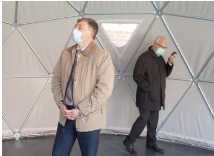
Prie Anykščių ligoninės sumontuota palapinė yra 130 kv. m. ploto, taigi prilygsta nemažam gyvenamajam namui.